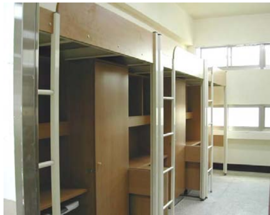
大雅館寢室內部設施