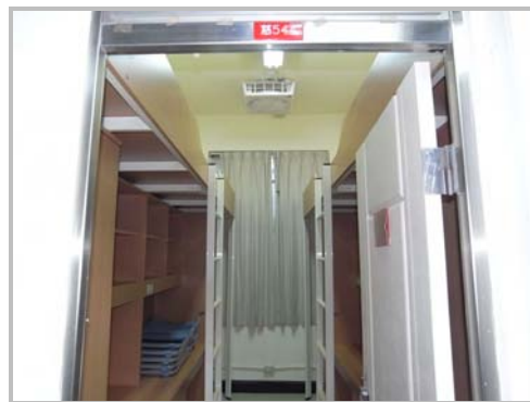
大慈館寢室內部設施