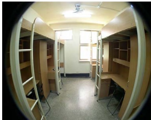
大倫館寢室內部設施