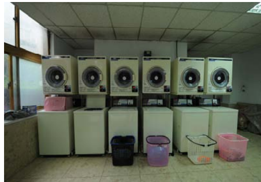
大莊館自助投幣式洗、烘衣機