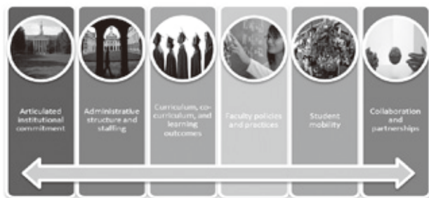
图1：美国教育委员会综合国家化模型

院校之间可持续发展的伙伴关系中至关重要的，是院校领导力和战略规划过程的承诺，它不仅是以一种连贯方式来吸引国际化的关键要素，而且在体制规划中设定了明确的目标和战略。那些确定哪些国家和院校将被选中参与的流程通知标准是重要的。在根本上，无论院校为制度绩效设置优先级建立何种标准，全球化协作的选择是必须被告知的。